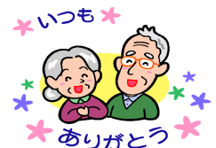
茶道教室「憩」 の皆さん